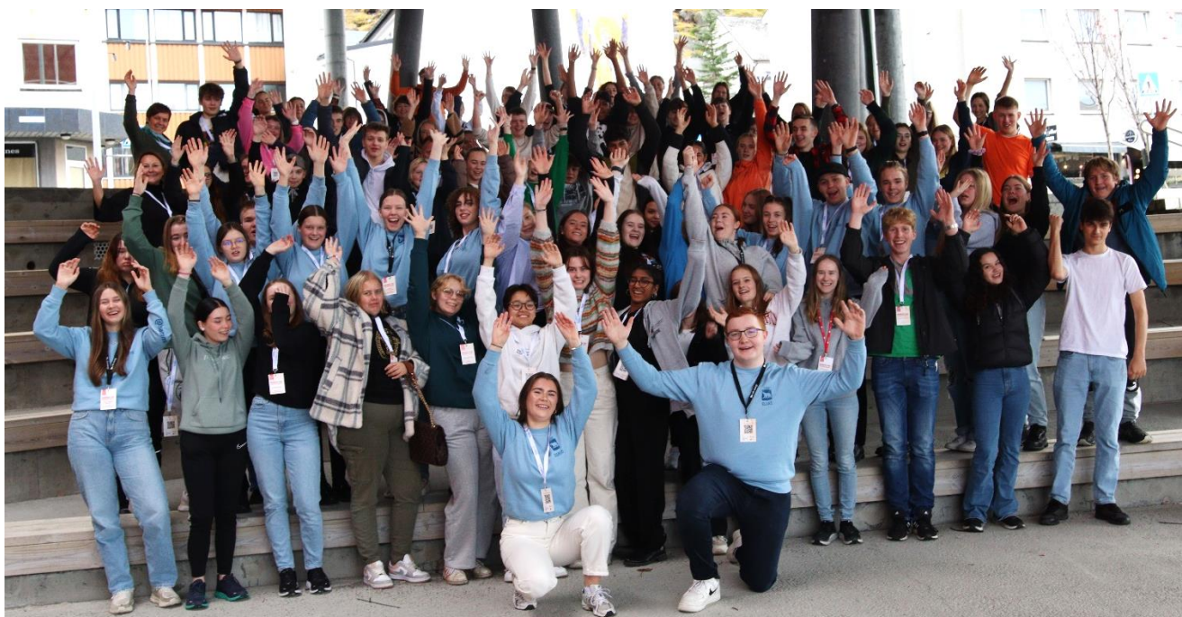
Bilde fra Ungdomsråd i Nord