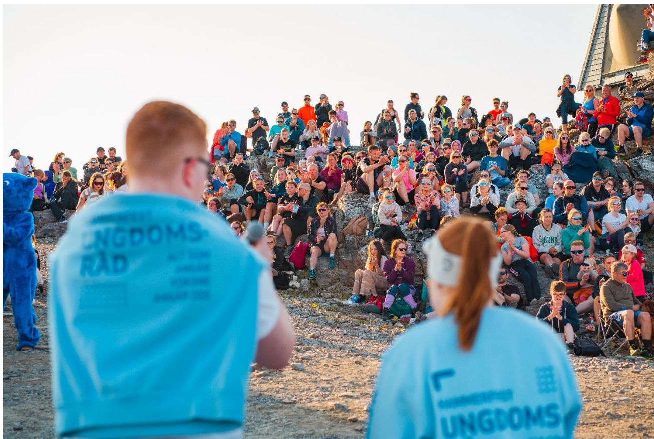
Vi storkoste oss med å hjelpe til med å arrangere Tyven-konserten.

Vi sendte flere medlemmer ned til Ung Kulturytring. Det er en utforsking av kulturpolitikk for barn og unge. Medvirkning og representasjon er et fokusområde for dette prosjektet. Møtet er en sjanse til å treffe andre politikinteresserte ungdommer og lære mer om kulturpolitikk.