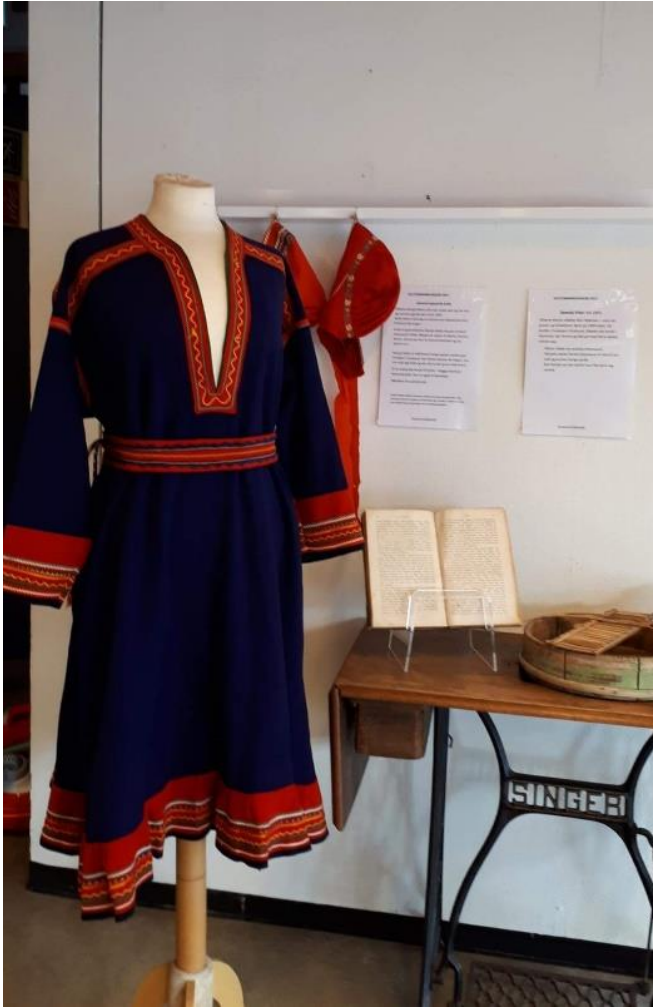
Sjøsamisk drakt utstilt under Kulturminnedager 2017