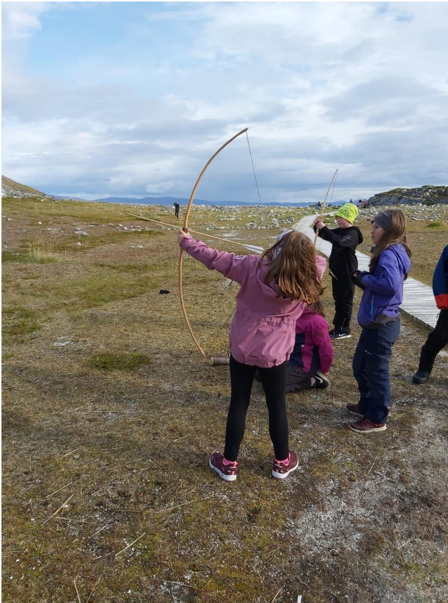
Barn som skyter med pil og bue i kulturmiljøet Kirkegårdsbruk

Planarbeidet skal ta hensyn til krav i Rikspolitiske retningslinjer for barn og planlegging og organiseres slik at barn og unges synspunkter kommer fram.