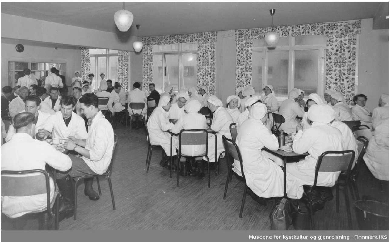
Museene for kystkultur og gjenreisning i Finnmark IKS

Regjeringen oppfordret til fornying av fiskeflåten og med motorisering kom den nye tid inn i fiskerinæringen. Men det førte samtidig for alvor kapitalen inn i næringen og endret fiskerbondetilværelsen. De fleste finansierte motorisering ved hjelp av lån, og for å betjene dem måtte det en jevnere drift til. Slik startet en spesialiseringsprosess som på sikt avviklet det meste av den gamle fiskerbondetilpasningen.