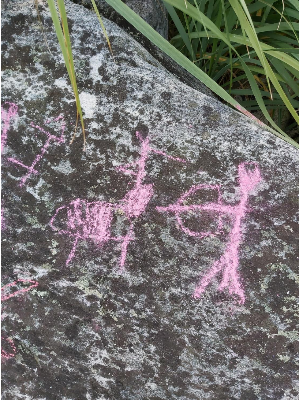
Helleristninger tegnet av barn i Forsøl

I arbeidet med kommunedelplan for kulturminner og kulturmiljøer vil vi gå nærmere inn på 11 utvalgte tema. Fokus vil bli satt på å identifisere utfordringer og behov for tiltak. Under hvert tema skal også den immaterielle arven på området beskrives.