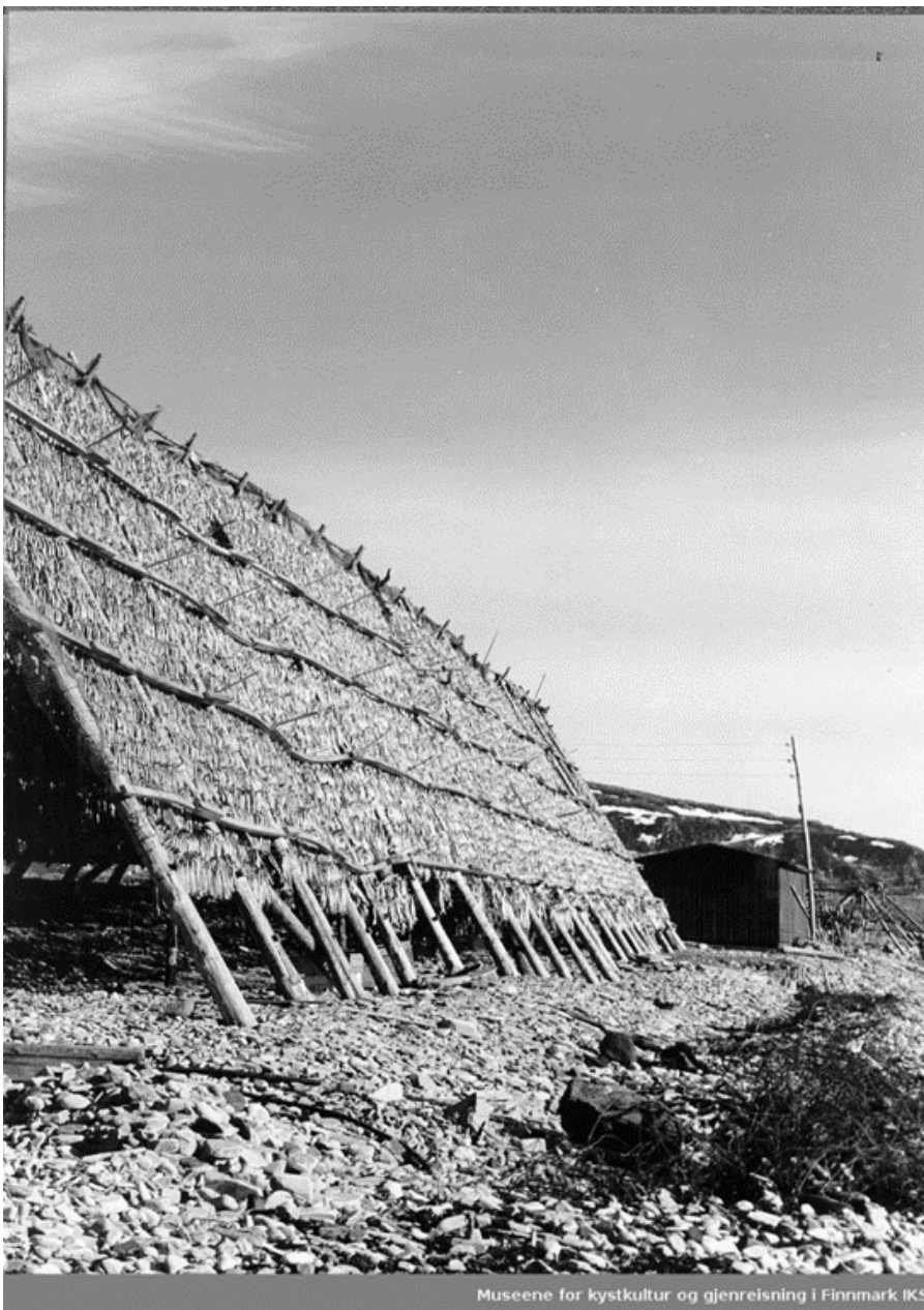
Museene for kystkultur og gjenreisning i Finnmark IKS

I 1681 ble det opprettet et særskilt handelsmonopol for Finnmark i et forsøk på å sikre forsyning av de mest nødvendige varene til Finnmark. Finnmark ble nærmest en koloni, der rettigheter for handel og sivil administrasjon av fylket ble gitt til Bergen. Det skulle ta enda 100 år før handelen i Finnmark ble frigjort.