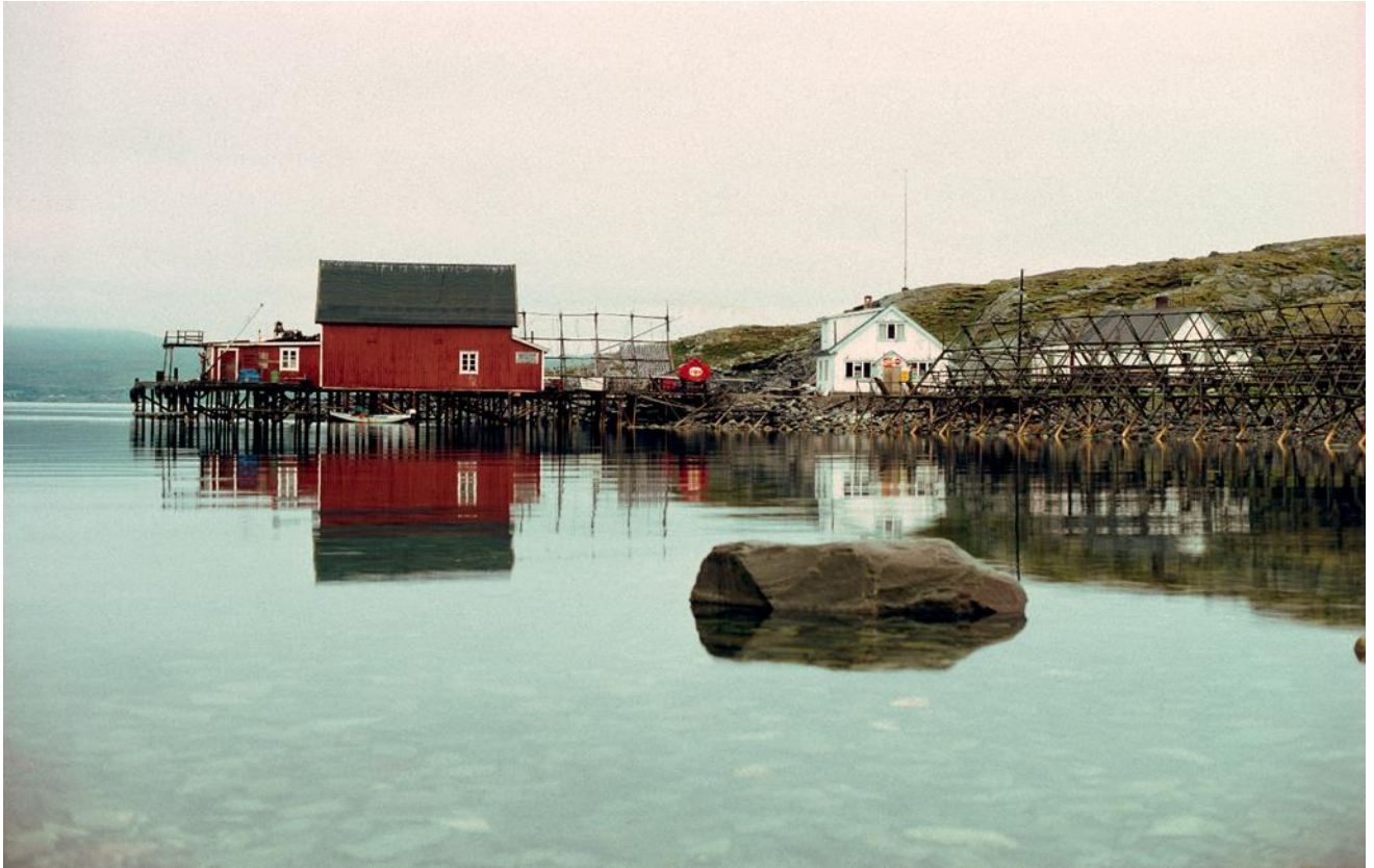
Fiskebruk i Klubbukt